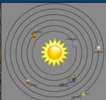
Det heliocentriske verdensbillede.