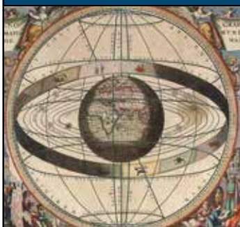
Det geocentriske verdensbillede.