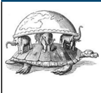
Det egyptiske verdensbillede.