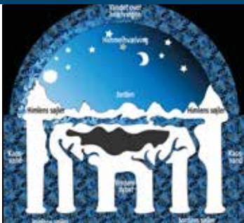
Det bibelske verdensbillede.