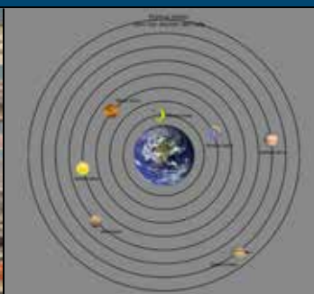
Det geocentriske verdensbillede.