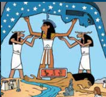
Det indiske verdensbillede.