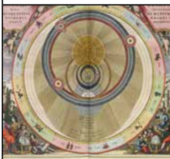
Det tychoniske verdensbillede