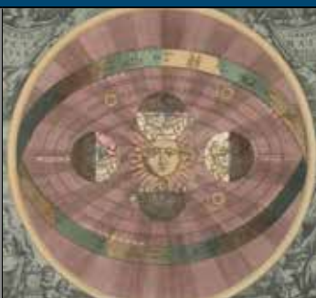
Det heliocentriske verdensbillede.