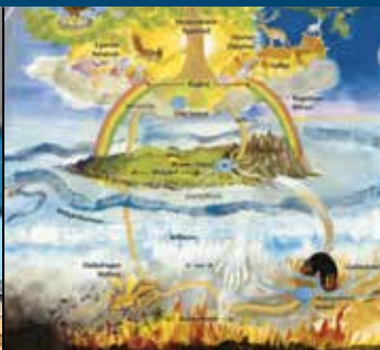
Det nordisk mytologiske verdensbillede